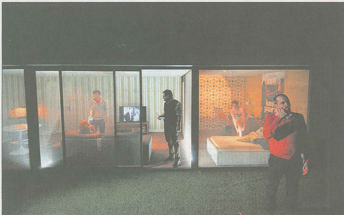
A travers un jeu d'écrans, «Le garçon du dernier rang» met en lumière le rapport de la salle à la scène. ISABELLE DACCORD

THÉÂTRE DES OSSES • Dans «Le garçon du dernier rang», le public entre dans le salon d'une famille. La pièce met en scène l'adolescence.