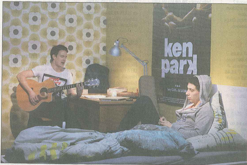
«Le garçon du dernier rang» met en scène l'esprit transgressif de l'adolescence. ISABELLE DACCORD