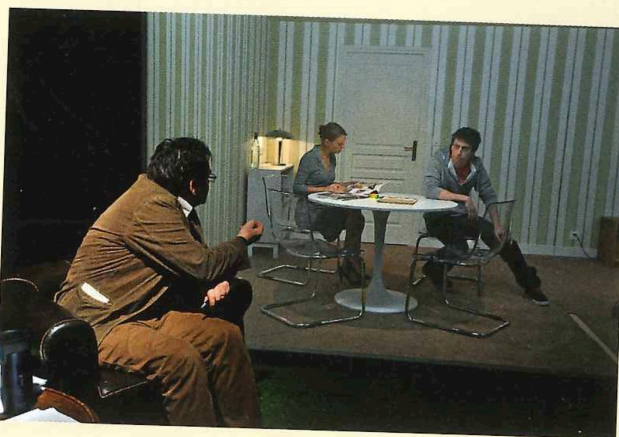
«Le garçon du dernier rang»

Avec sa deuxième création maison, le Théâtre des Osses propose de faire découvrir un auteur espagnol, Juan Mayorga. Né en 1965, philosophe de formation, professeur de dramaturgie, il a fondé le collectif „El Astillero“ à Madrid. Ses nombreuses pièces (dont une „Lettre d'amour à Staline“) ont été jouées avec succès en Espagne ainsi qu'à l'étranger, en France notamment. „Le Garçon du dernier rang“ a fait l'objet d'une adaptation cinématographique signée par François Ozon („Dans la maison“) en 2012.